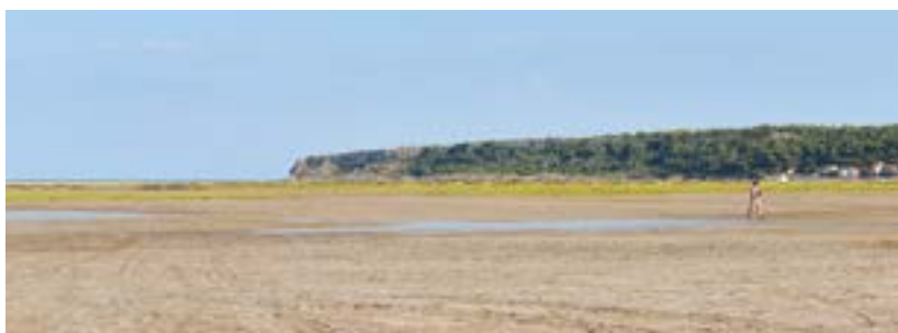
L'îlot des Coussoules et la falaise de Leucate.