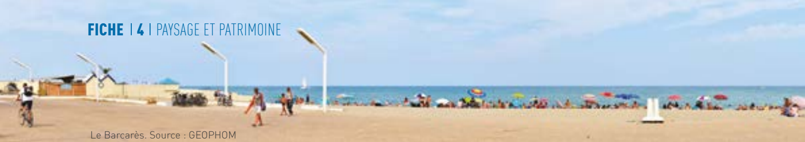
Le Barcarès.