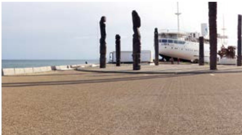
Le Lydia, Le Barcarès.