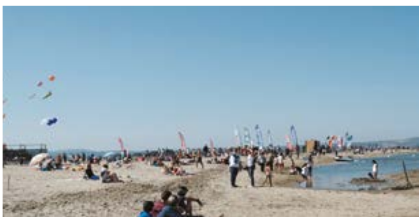
Plage de la Franqui à Leucate.