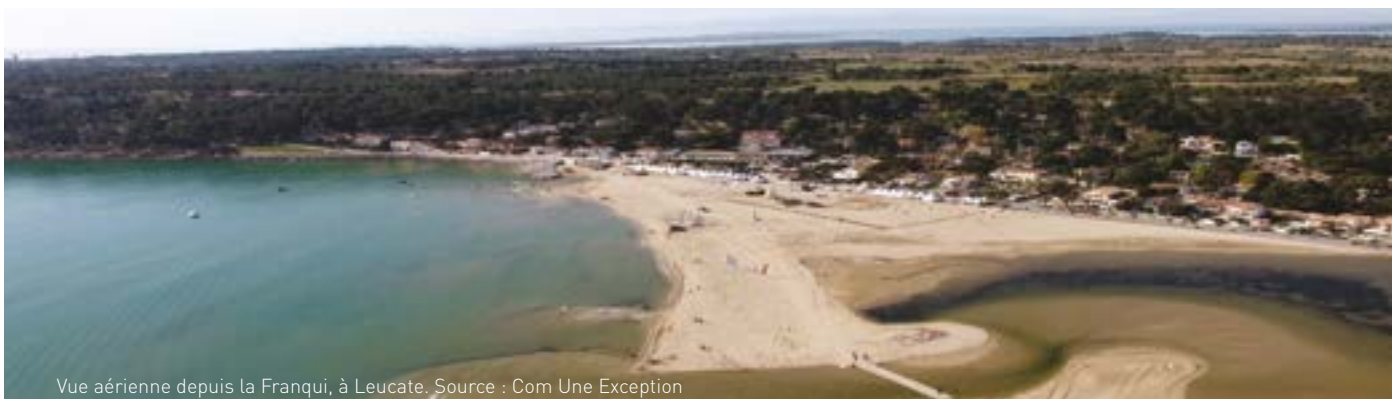
Vue aérienne depuis la Franqui, à Leucate.

La qualification et la quantification des impacts paysagers du projet de ferme pilote ont été expertisées par le bureau d'étude ABIÉS. L'approche retenue repose sur une double évaluation :