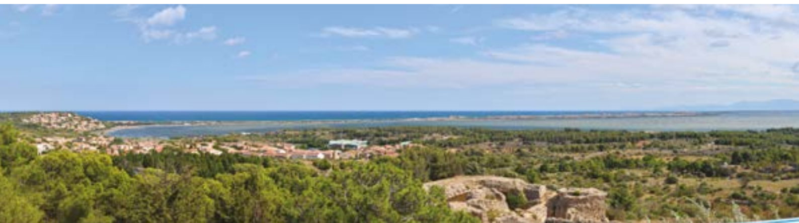
Ruines de la chapelle, Leucate.