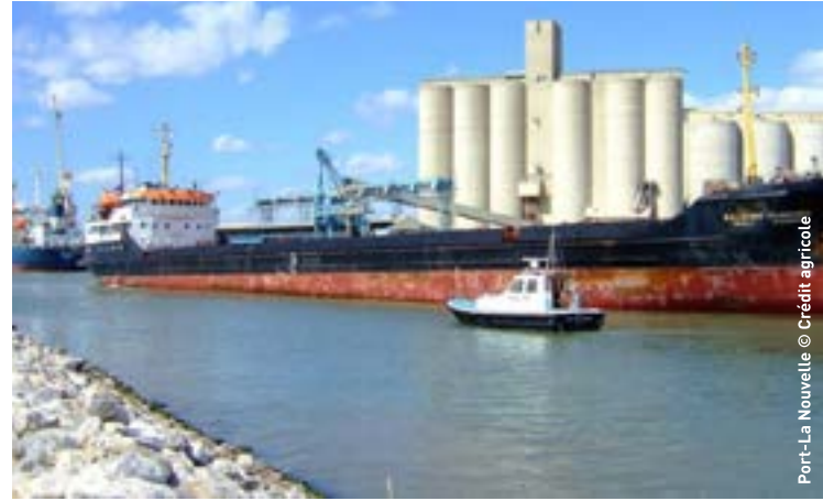
Port-La Nouvelle

Les navires de commerce concernés par le projet sont en grande majorité des cargos au départ de Port-La Nouvelle à destination des eaux espagnoles, ou inversement en approche de Port-La Nouvelle en provenance d'Espagne. On dénombre en moyenne 140 passages par an à moins de 1 M de la ferme pilote. Quelques navires transportant des hydrocarbures traversent aussi la zone (de l'ordre de 20 par an à moins de 1 M), mais le flux principal reste concentré sur l'axe Port-la Nouvelle-Marseille/Fos-sur-Mer.